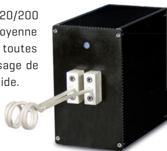
TÊTE DE CHAUFFE HH18 pour Power Cube 360/200