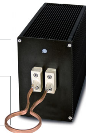
TÊTE DE CHAUFFE HH19 pour Power Cube 720/200

* Les inducteurs des figures ne sont montrés qu'à titre d'exemple