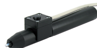
Dosiergriffel mit Fingerschalter und Spannutter im Lieferumfang enthalten 560989-B-V